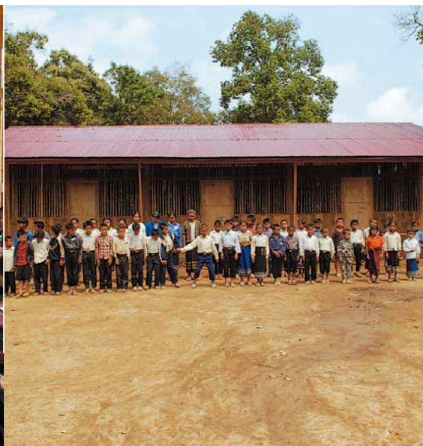
Einfach aber effektiv: eine der Grundschulen, die „Die Bambusschule“ bereits in Laos aufgebaut hat.

aufnehmen und wir waten durch ein Bachbett. Unsere Schuhe sind natürlich wasserdicht – was bedeutet, dass das von oben hineinfließende Wasser auch sicher im Schuh bleibt und bei jedem Tritt dieses unvergleichliche, schmatzende Geräusch erzeugt. Dank eines dichten Blätterdachs hoch über uns prasselt der Regen nicht direkt auf den Boden (und uns), er trieft vielmehr von den Bäumen – es scheint, als ob die Blätter Wasser schwitzen. Wir tun das jedenfalls, denn es sind immer noch satte 30 Grad und wir sind froh, als endlich die Häuser des Dorfes auftauchen.