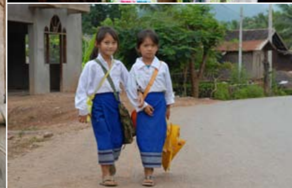
Links: Am Mekong bei Luang Prabang, dem Ausgangspunkt unserer Reise. Rechts: Auf unserem Weg in ein Dorf der Khmu.